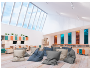
Miljösmarta inköp – sid. 4, 5, 6, 7, 10, 11