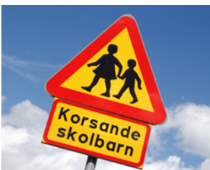
6 av 10 kör för fort – sid. 18