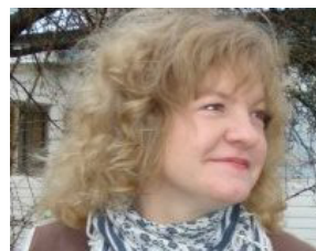
Vaktmästarprofilen – sid. 14-15