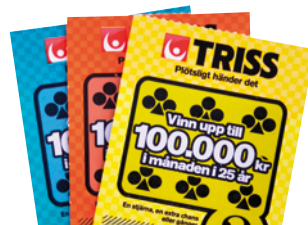
Var med och tävla om miljoner på – sid. 22